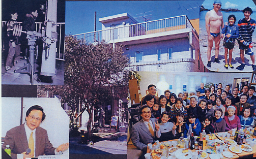
2008年1月参加者での初学舎(55歳)