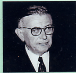
カルトル 1905 ~ 1980

人間は、自由から逃げることはできない。実存的価値、実存的精神分節。 20世紀フランスの実存主義者カールは、フーベル文学賞を辞退。日本での受容は竹内芳郎が中心。