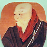
親鸞 1173 ~ 1262

他力念仏の法然門徒は、後鳥羽上皇らにより弾圧され、親鸞は佐渡に島流しとなり、4人が死罪となる。 親鸞は、中世日本の実存思想の中心。「善人でさえ往生できる(救われる)のだから、悪人はなおのこと」浄土真宗はわが国最大の宗派で、晩年のハイデガーは、西欧哲学から離れ、親鸞思想に傾倒し、心酔した。